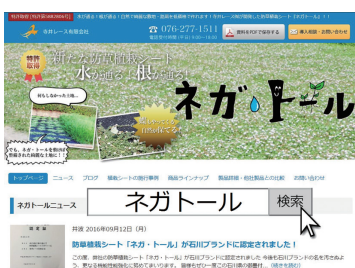
ウェブには施工事例も掲載

品が売上の柱となっていますが、本製品の供給は県内外に広がりつつあり、売上の三本目の柱に成長させるべく、現在、製品の研究に積極的に取り組んでいます。