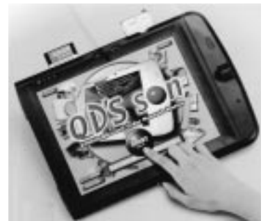
この無人端末機を使って、誕生や結婚等のポストカードを自分で作成できる。

お客様から大変な好評を得ている。また、デジタル処理は、業務用に変重宝がられている。即ち自動車の事故写真、建設現場の写真、建物の完成予想図作成、年賀はがき