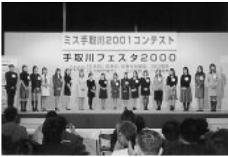
ミス手取川2001コンテスト

手取川の豊かな恵みをPRしました。 特設ステージでは歌手の門倉有希さんによる歌謡ショー、ミス手取川コンテストな