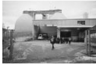
としては世界でもトップクラスにある。市として一週間に一度収集した食品や木の葉などの生ゴミ（積んであった量を見ると、家庭からの排出量は日本と比べて極端に少ない）は焼却するのではなく、環境保全やリサイクルの思想から「堆肥」処理し、伴って発生するメタンガスで施設内の発電機を動かし、その電力で下水の浄化処理を行い、河川に戻している。

この施設は、一九九三年に下水処理施設を建設、次いで生ゴミ施設を併設し、併合処理施設