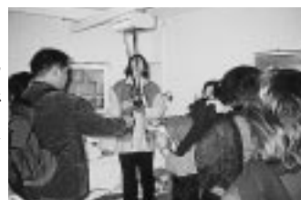
重度障害者が入居して社会生活をしている集合住宅（グループハウス）を視察した。当住宅は、二階建てで九人が入居しており、ここでは二十六名のスタッフが二十四時間体制で入居者の生活支援を行っている。

一部屋当たりの個室面積は四十㎡以上が確保されており、各部屋ともホテル並みに整理・整頓がなされており、個性を生かしたインテリアが入っていた。