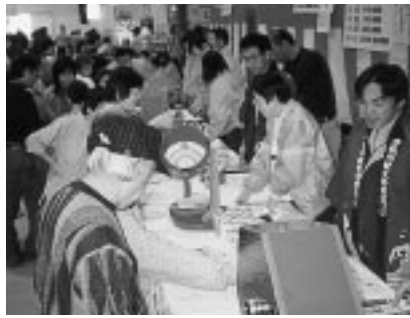
多くの人で賑わう会場

どが行われた他、マグロの解体や各種模擬店など、会場のあちこちで列ができて、また好天に恵まれたこともあり、両日とも町内外の多数のお客さんで賑わいを見せました。