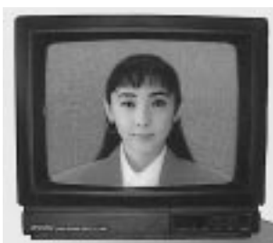
デジタル処理により、モニターを通じて映り具合をチェックして撮影ができる。

環境が厳しくなればなる程独創性が強く求められ先行が有利となる。現在のホリ写真館の在り方は如何に独自色を出し、他人より先に行くかと