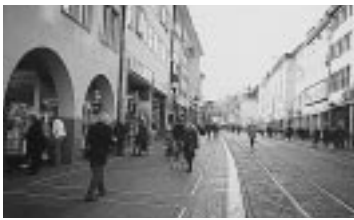
中心市街地の専門店を守るため

交通対策としては、路面電車等路線の拡充による公共交通機関の利用促進、その奨励等として、定期券「環境カード」を発行して全長二千四百kmの広範囲で乗り放題としている。駐車場を減らして駐輪場を大規模に増やし、自転車専用道路も百四十kmにおよび整備している。