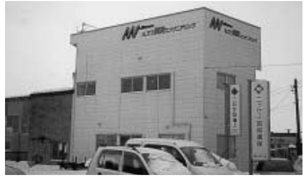
現在のミズワ潤滑エンジニアリング