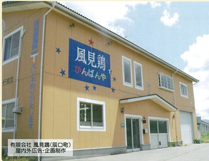
有限会社 風見鶏(辰口町) 屋内外広告・企画制作